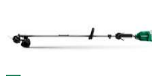
Freischneider CG18DA loop handle 332.-