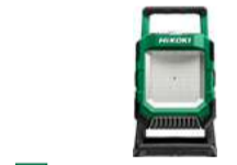
Baustellenstrahler UB18DC 4,000 Lumen 261.-