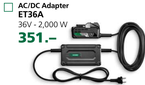
AC/DC Adapter ET36A 36V - 2,000 W 351.-