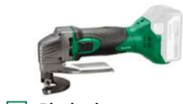
Blechscher CE18DSL Max. 2,3 mm 536.-