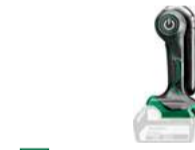
Lampe UB18DJL 230 Lumen 74.-