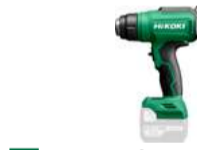
Heissluftpistole RH18DA 30-550° C 211.-