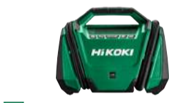
Kompressor UP18DA 11 bar - dual function 199.-