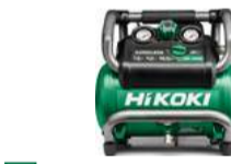
Kompressor EC36DA 7,6 L - 135 psi - 12,4 kg 549.-