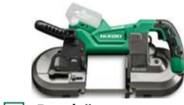
Bandsäge CB3612DA 127 x 120 mm 674.-