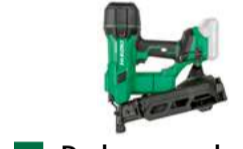
Dachpappnagler NV1845DA DN16 - 25-45 mm 874.-